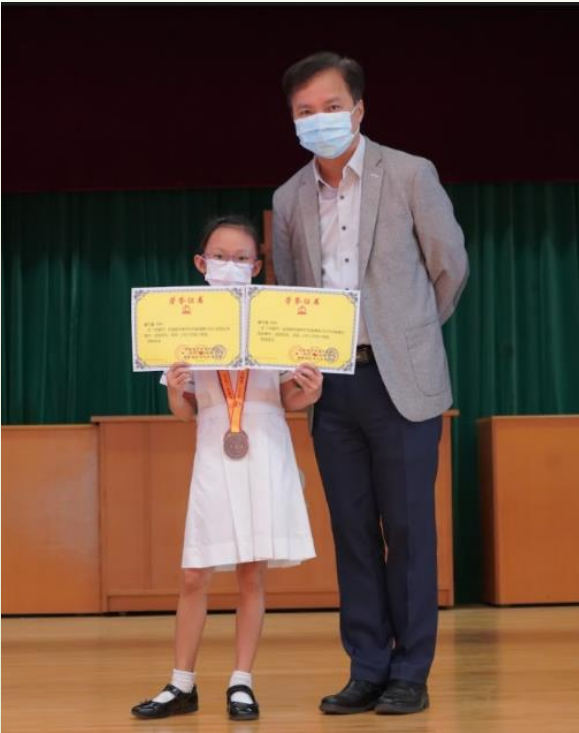
3E 蘇芍縈同學於「華夏盃」全國數學奧林匹克邀請賽 2020 (華南賽區)晉級賽及全國總決賽中分別榮獲三等獎。