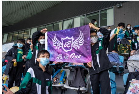
啦啦隊落力為同學打氣。