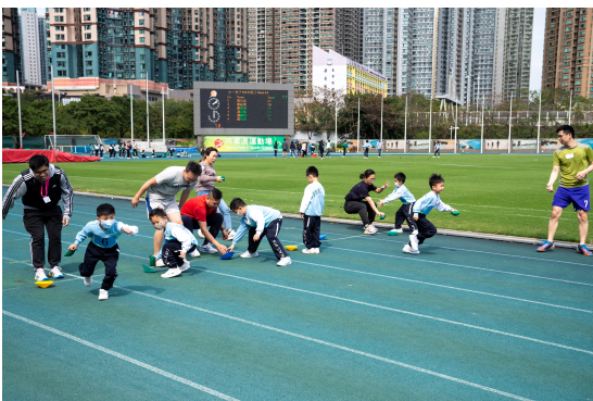
家長也與子女一同參加者接力賽，十分投入！