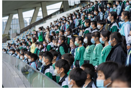
運動會開始前，全場肅立，齊唱國歌。