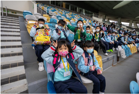
一年級同學第一次參加運動會，好開心呀！