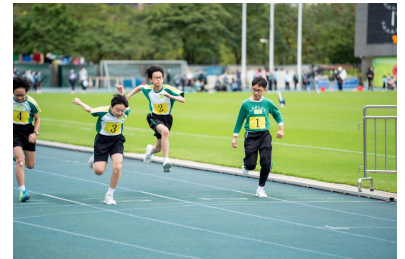
健兒努力向前跑，充滿衝勁。