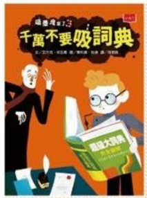
吸靈鬼來了3： 千萬不要吸詞典