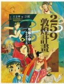
259 敦煌計畫 (可能小學的藝術國寶任務4)