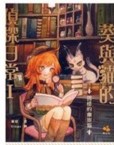
葵與貓的偵探日常1： 閨樓的幽靈貓