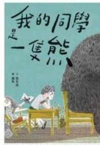
我的同學是一隻熊