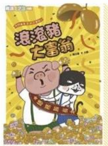
快閃貓生活諺語童話2： 滾滾豬大富翁