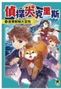
偵探犬克里斯3： 豪華郵輪大冒險