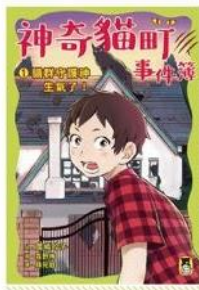
神奇貓町事件簿 1. 貓群守護神生氣了