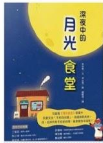
深夜中的月光食堂