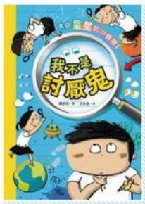
我不是討厭鬼 (來自星星的小偵探1)