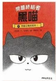
問題終結者黑貓1： 守護公寓的和平！