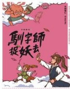
字的傳奇1：馴字師捉妖去