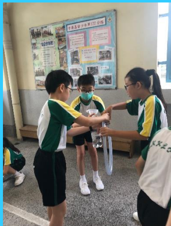
同學既要利用喉管及漏斗把水運送到保特瓶內，又要憑量感猜出液體容量，真不簡單！