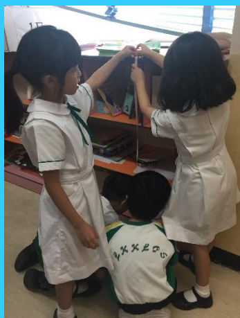
年紀小小的一年級同學正同心協力地找出課室薄櫃的高度！

數學組於6月份舉辦了度量活動，活動以小組形式進行，講求估計及量度技巧，要求同學先建立及使用估量方法，再透過動手操作來實際量度，藉此訓練他們的協作能力、溝通能力及量度感。以下是部分度量活動的活動相片。