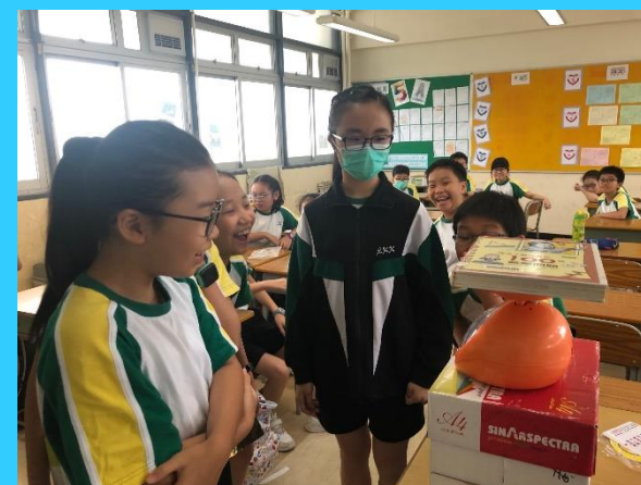
如果要拿出一件1kg的物品，你會想到甚麼？這組同學決定拿出這本書，看看它是不是1kg！