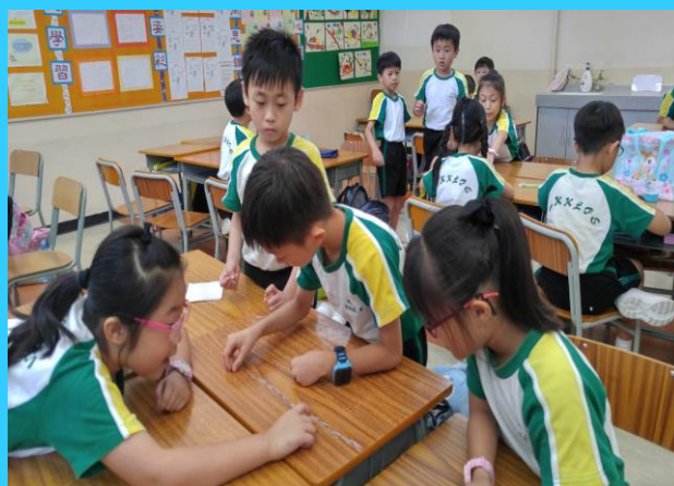
原來利用萬字夾來找出學生桌子的長度是非常不方便呢！