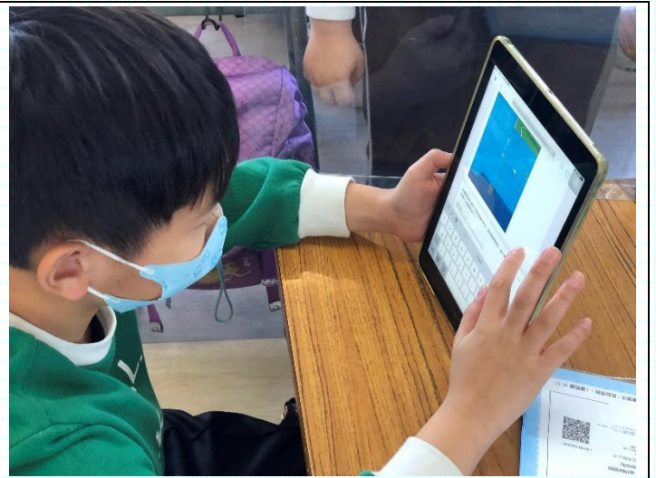
同學認真地閱讀題目，嘗試找出正確答案。