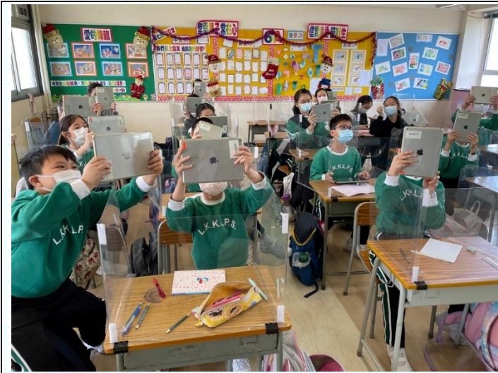
同學們利用 iPad 掃描 QR code 開始活動。

本年度數碼遊蹤(P. 4-6)把以往的數學遊蹤題目與科技結合。同學透過 iPad 閱讀有關校園不同地方的資料，然後再解決相關的數學題目及於 Google Form 輸入答案。同學們十分積極參與活動，讓我們一起看看活動的花絮。