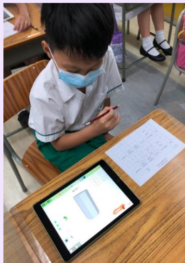
同學運用電子軟件(e+立體圖形)從不同的角度學習立體圖形。